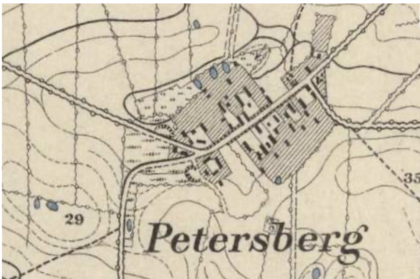
Das Dorf Petersberg in der Preußen-Karte von 1877

An dieser Stelle ist es wichtig , daran zu erinnern, dass in Mecklenburg die Abhängigkeit der Menschen vom Grundherrn das Leben bestimmte (Leibeigenschaft). Im vorhergehenden Fürstentum Ratzeburg hatte sich jedoch eine freie Bauernschaft entwickeln können, die u.a. dazu führte, dass sich die Menschen auch frei bewegen konnten, z.B. von Mecklenburg nach Ostholstein oder Lübeck.