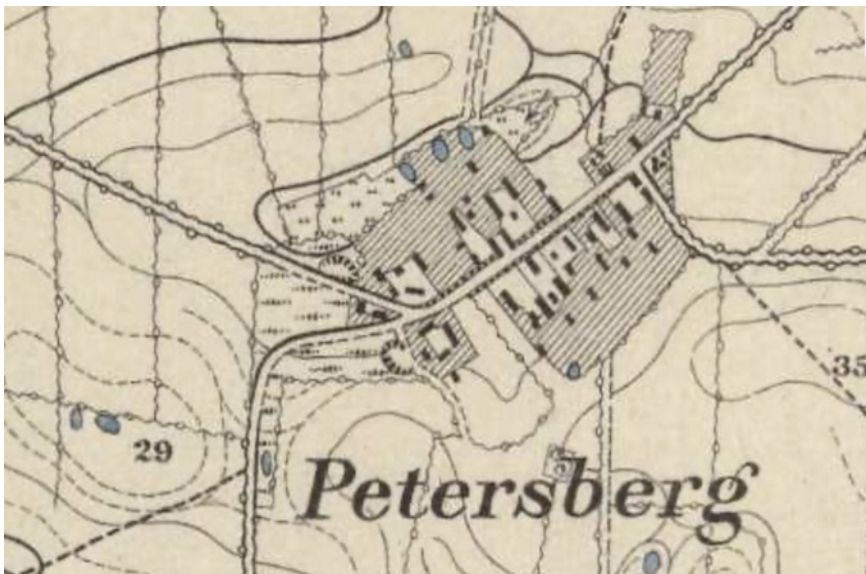
Das Dorf Petersberg in der Preußen-Karte von 1877