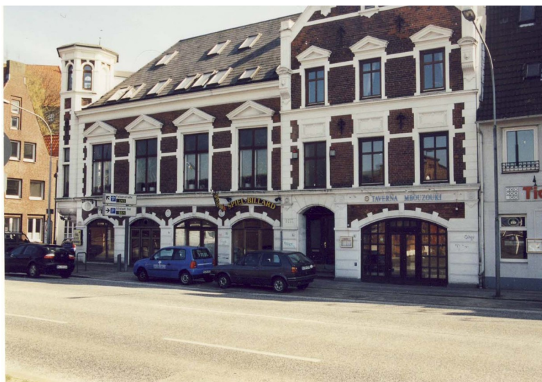
Petit-Haus 2002, re. die griech. Taverna: Untertrave 3f

In diese Zeit des Gaststätten-Betriebes seit 1862 fielen die Geburten von 7 Kindern (2 weitere waren vor dieser Zeit geboren) und auch die Sterbefälle von 2 Kindern.