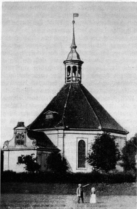
Kirche in Rauterskirch (Alt-Lappienen)