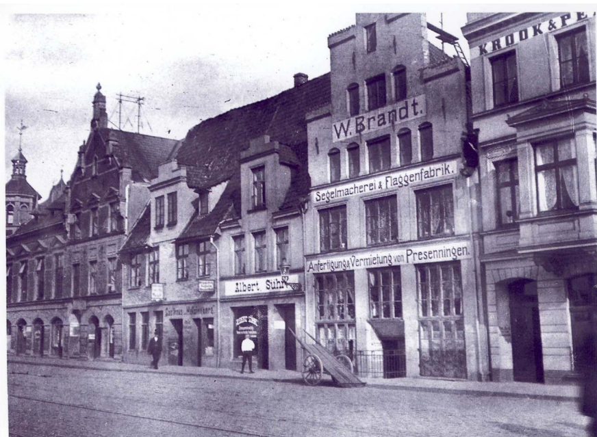
An der Untertrave 3 bis 7 (ganz links Petit-Haus) um 1925

1442 hatte der Senat an dieser Stelle ein Eckgrundstück (Kleine Alte Fähre) mit 2 Häusern gekauft und ein Bordell eingerichtet, bis 1581(?). Das Petit-Haus dürfte um/vor 1868 gebaut worden sein.