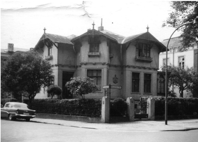
Kronsfordter Allee 7, Ecke Pleskowstr.

Foto um 1963, das Haus wurde 1964 im Rahmen von Erbstreitigkeiten verkauft, dann abgerissen und durch einen Neubau ersetzt.