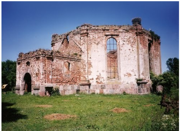
Ungewöhnlicher achteckiger Kirchenbau, rechts die Ruine der Kirche in Alt-Lappienen 2001. (google-earth 55° 05' 40.37" N 21° 25' 08.54" O)

Als Ort oder Dorf sollen diese Plätze heute aber nicht mehr erkennbar sein, die Zerstörungen des letzten Krieges waren wohl nicht sonderlich groß, aber die nachlässige Unterhaltung zu Sowjetzeiten und der Abbruch der alten Häuser zur Ziegelgewinnung für neue, beschleunigten den Verfall besonders in den letzten Jahren.