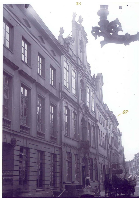
links: Blick in die Wahnstraße um 1925, li. Nr.42 (neu), schräg gegenüber Haus Nr. 41, li. daneben dann Nr. 39, 37 usw. Richtung Königstraße, rechts: Die Königstr. um 1910 (hinten das Haus Nr. 87)