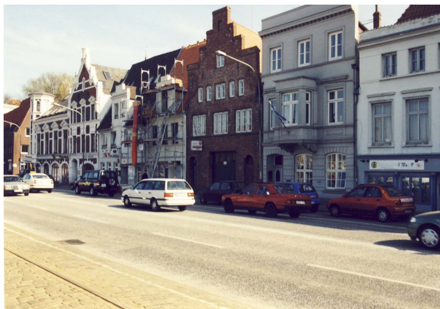
An der Untertrave 3 bis 8 (links, Petit-Haus, frisch renoviert, ohne vollständigen Turm links) 2002