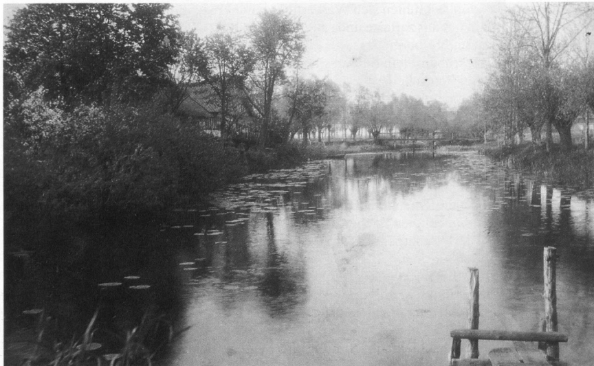
Dieses Foto zeigt die Alte Gilge im Gilgenfeld, gleich hinter der Schule. Eine wahre Idylle – damals. Foto aus dem Jahre 1927.